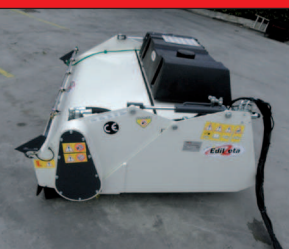
Posizionatura del serbatoio acqua