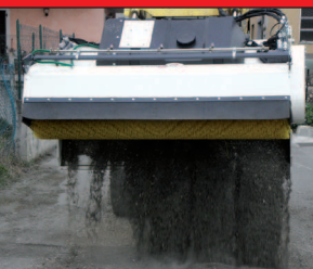
Fase di scarico con spazzola alzata