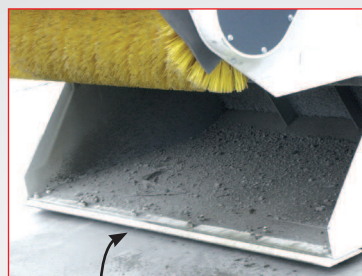
Particolare della lama bullonata. Accessorio a richiesta.