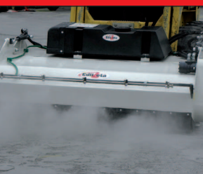
Kit innaffiante in funzione

BENNE MISCELATRICI - BENNE SPAZZATRICI - FORCHE PALLET