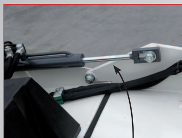
Particolare del cilindro idraulico con registro a vite per regolazione spazzola.