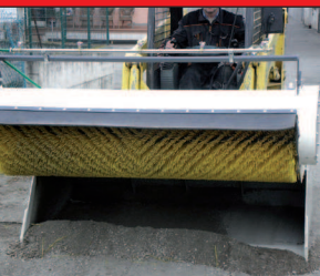
Fase di carico con spazzola alzata