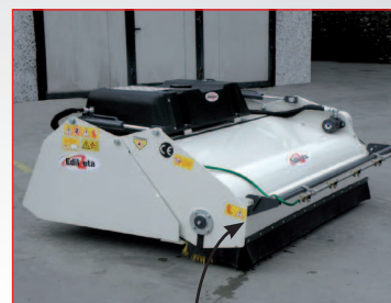
Particolare del kit innaffiante reversibile con gancio di blocco.