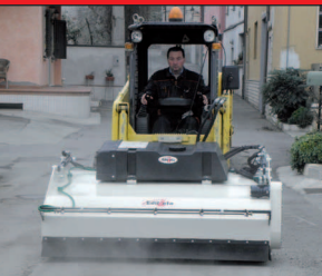
Fase di pulitura